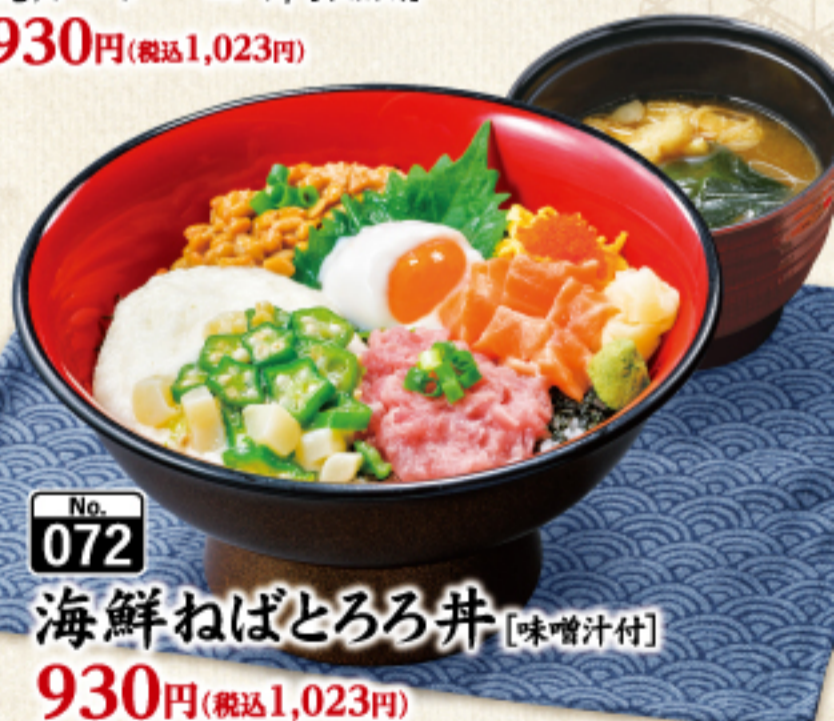
No. 072 海鮮ねばとろろ丼 [味噌汁付] 930円 (税込1,023円)