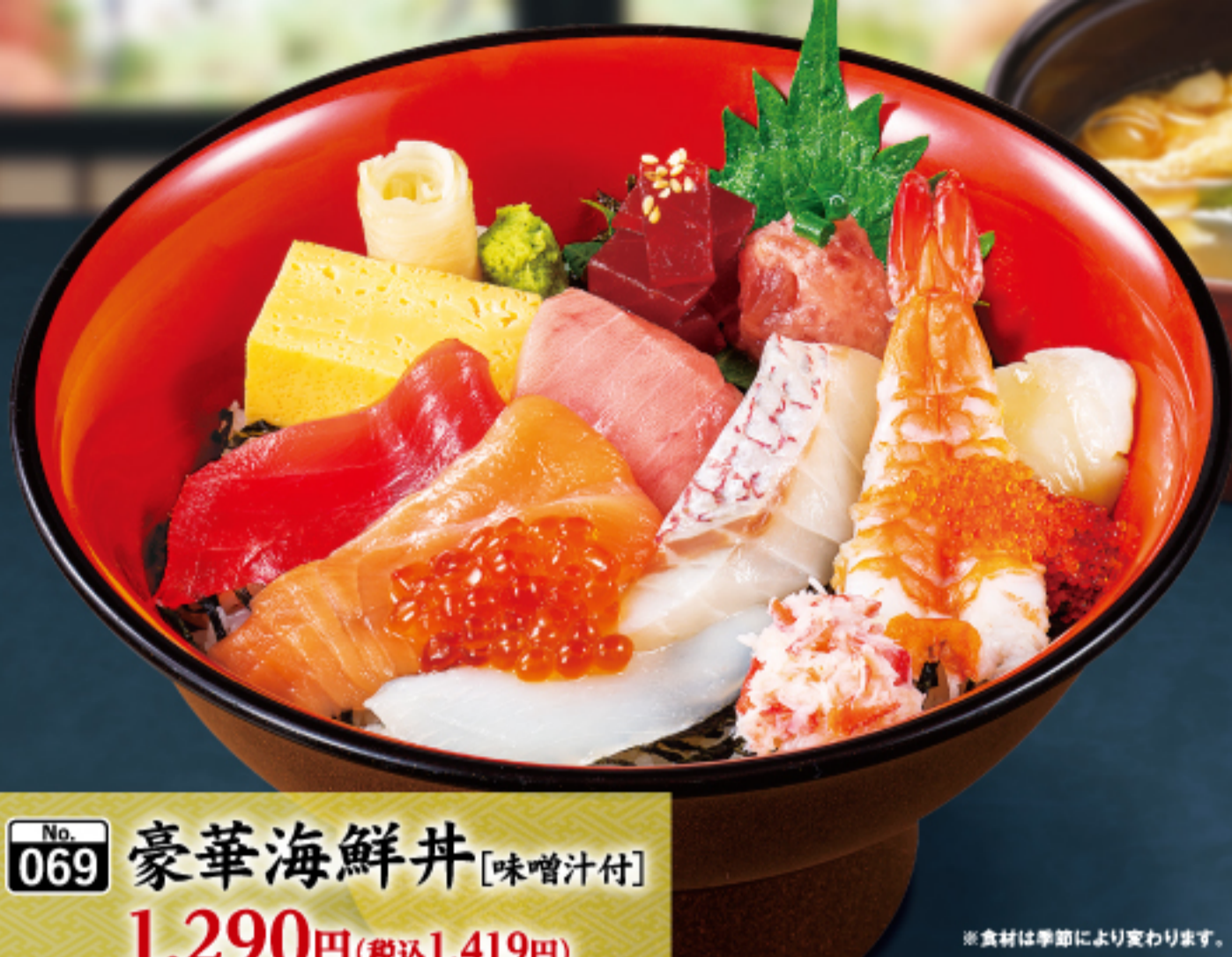
No. 069 豪華海鮮丼 [味噌汁付] 1,290円 (税込1,419円)