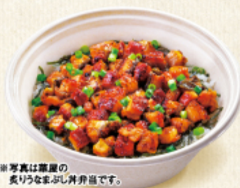
※写真は華屋の炙りうなまぶし井弁当です。