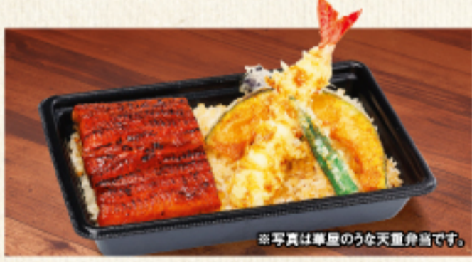
※写真は華屋のうな天重弁当です。