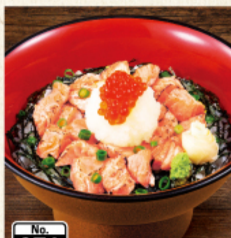
No. 071 炙りトロサーモン丼 [味噌汁付] 930円 (税込1,023円)