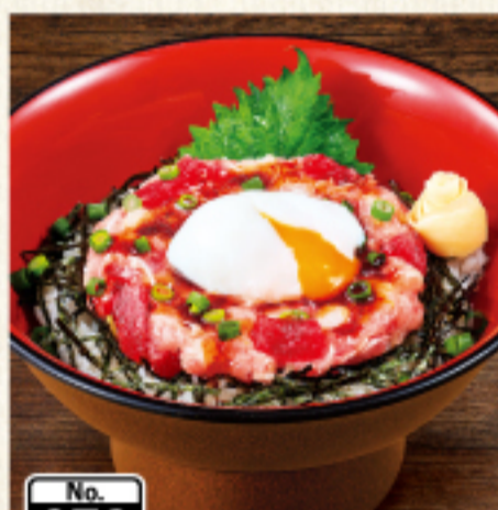
No. 070 まぐろユッケ丼 [味噌汁付] 1,030円 (税込1,133円)