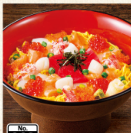
No. 068 北海ちらし [味噌汁付] 1,130円 (税込1,243円)